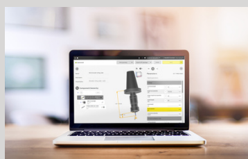
工具3Dモデルアセンブリ CoroPlus® ツールライブラリ